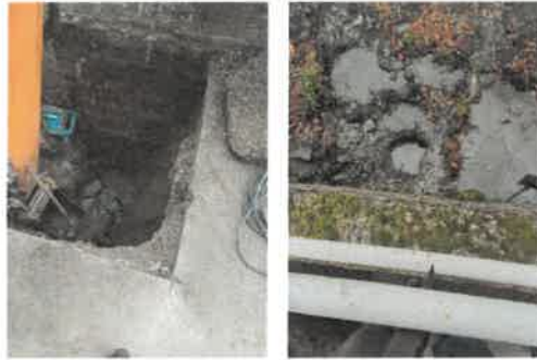
FOTO DEI SONDAGGI EFFETTUATI